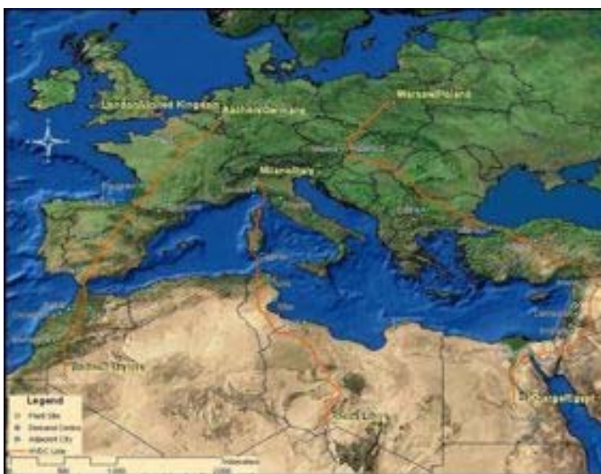
HVDC-Traces analysed in the DLR- study TRANS-CSP for Trans- Mediterranean power transmission.